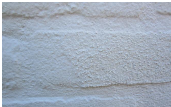
Pukkels in verfsysteem door sulfaatuitbloeiing